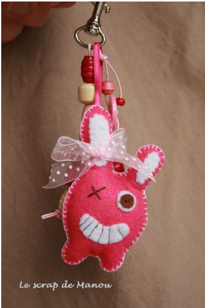
Le scrap de Manou