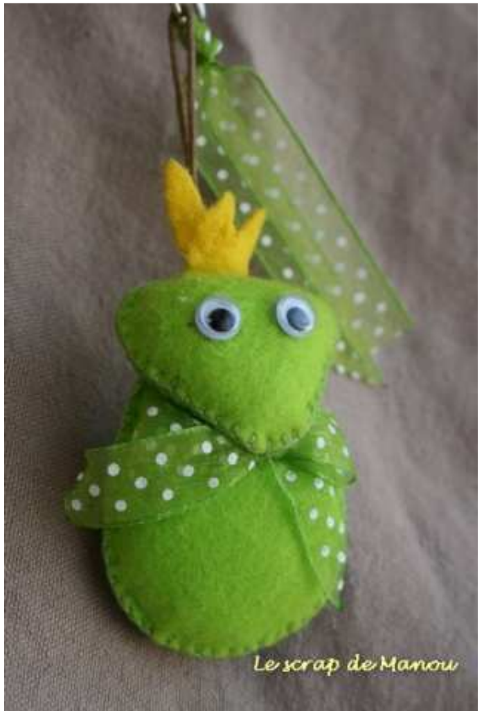
Le scrap de Manou