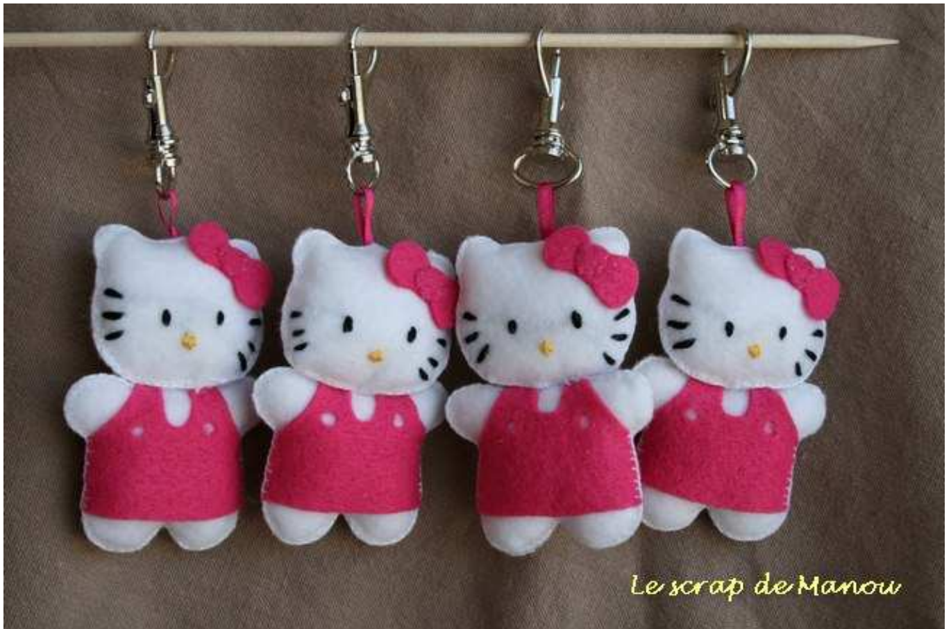
Le scrap de Manou