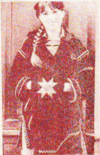
LE CABAN S'ENLUMINE (suite de la page 48)