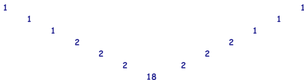
Tableau des mailles de l'encolure mises en attente sur plusieurs aiguilles.

DEVANT : comme le dos, sauf pour l'encolure qui se réalise 10 rangs plus tôt.